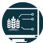
SMARTCROP Competividade Sustentável